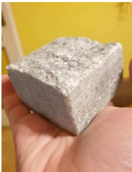
Pre posúdenie farebnej vhodnosti a štruktúry kameňa prišla nám poštou do Senice najskôr takáto vzorka mramoru.