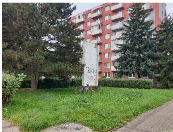
O niekoľko týždňov bude z neho na tomto mieste skutočný a dôstojný pamätník. Dovtedy nás však čaká úloha - odstrániť starú železobetónovú konštrukciu a vyčistiť priestor od odpadu.