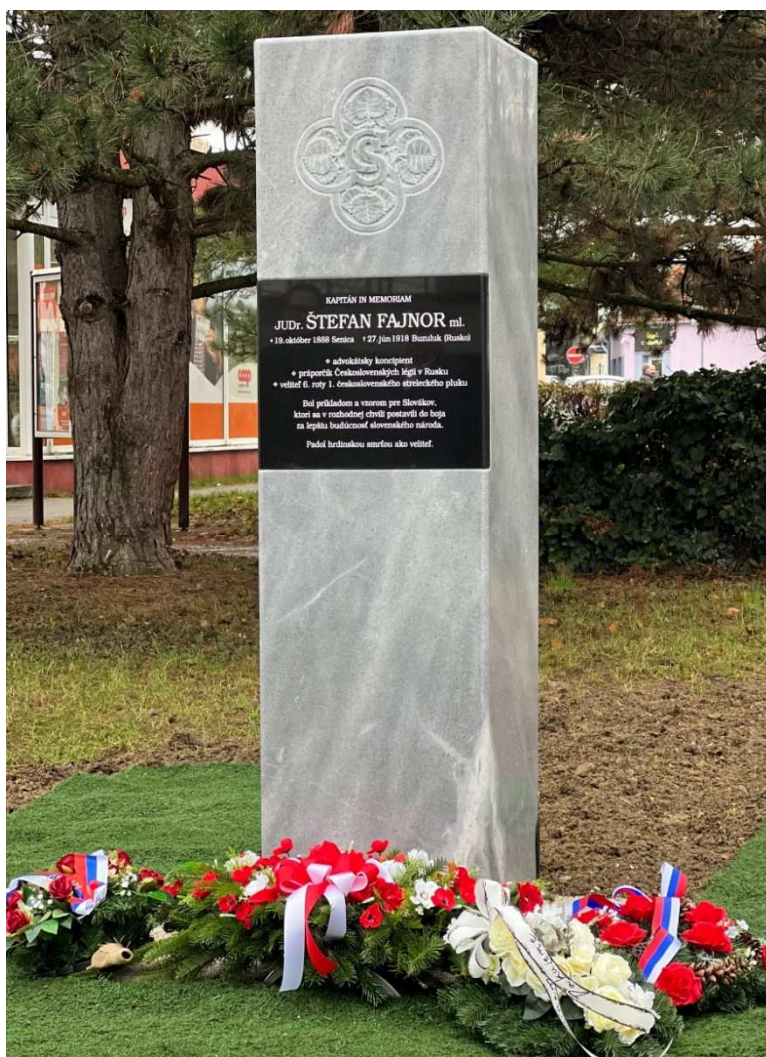
Pamätník v Senici chvíľu po odhalení, 28.11.2023