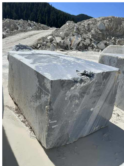
Mramorový blok na pamätník chvíľu po vyťažení v lome v Bulharsku. Odtiaľ bol prevezený na formátovanie a leštenie do Prahy.