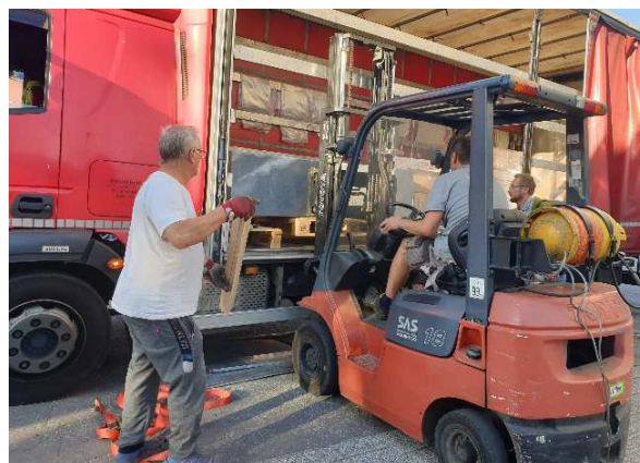
A konečne očakávaný náklad šťastlivo dorazil do Senice...