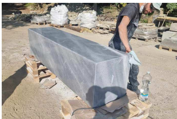
Toto je budúci pamätník. V túto chvíľu sa nachádza ešte v Prahe, ale o pár minút bude už naložený na kamión, aby sa priblížil do rodiska Š. Fajnora ml..